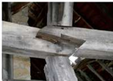
Assomblage à trait de Jupiter désorganisé