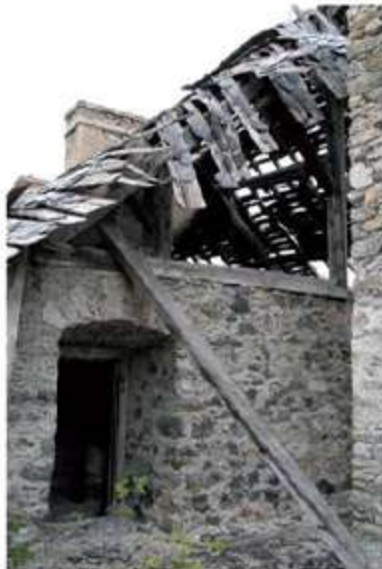
Etat de la charpente