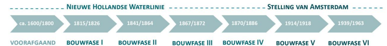
Tijdlijn bouwfases Nieuwe Hollandse Waterlinie en Stelling van Amsterdam

Het voorliggende document is gebaseerd op het format dat de Rijksdienst voor Cultureel Erfgoed (RCE) heeft aangeleverd. In dit geval betreft het een bijzondere nominatie. Het gaat namelijk om een uitbreiding van een bestaand werelderfgoed. Bij de beoordeling van de aanvraag leggen UNESCO en het adviesorgaan ICOMOS de focus op de uitbreiding en kijken naar de uniciteit van de aanvulling. Het document is daarom vanuit het perspectief van de NHW geschreven, waarbij regelmatig verband gelegd wordt tussen de SvA en de NHW om de unieke meerwaarde van de uitbreiding voor dit werelderfgoed expliciet te maken.