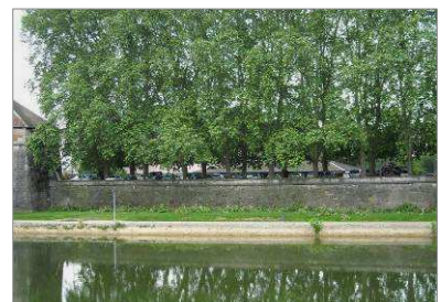
Les aménagements paysagers des fortifications de Besançon (avant / après intervention).