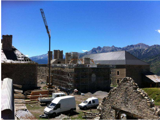
L'opération de sauvetage des casernes du fort du Randouillet à Briançon.

Parmi les bonnes pratiques partagées par le Réseau Vauban :