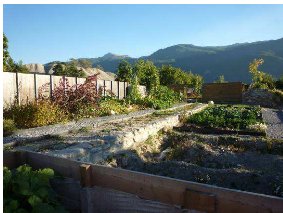
Le projet culturel de territoire de la place forte de Mont-Dauphin « Cultivons aujourd'hui le jardin de Vauban ».